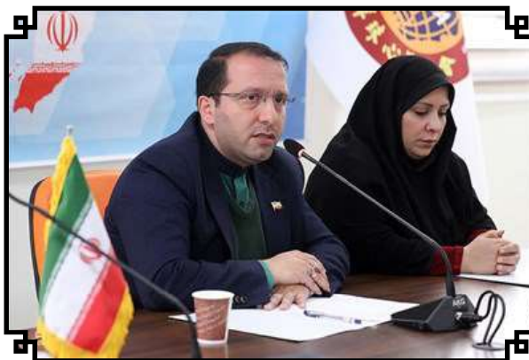
نشست خبری کودکان هوشمند