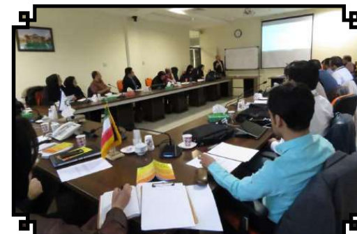
دوره پرورش ارزیاب جایزه تعالی ملی صنعت گردشگری