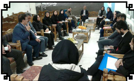
جلسه اعضای وابسته ایرانی UNWTO