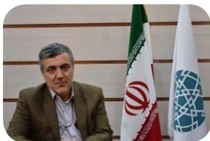
دکتر مهدی کشمیری؛ مدیر کل دفتر سیاست گذاری و برنامه ریزی امور فناوری معاون پژوهش و فناوری وزارت علوم

قائم مقام امور فناوری معاون پژوهش و فناوری وزارت علوم: