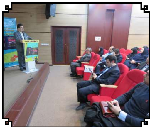
رویداد کارآفرینی اسلوب